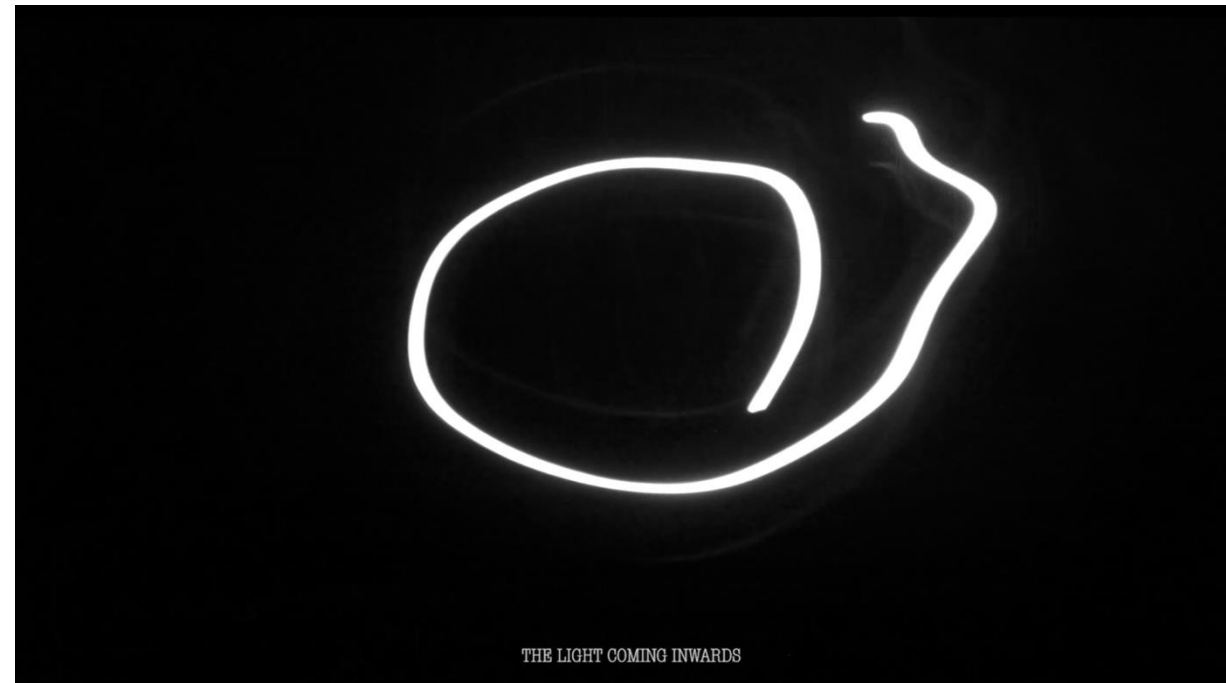
Writing Georgian alphabet in the air with the camera

Medium: Digital video camera, light, text, silent